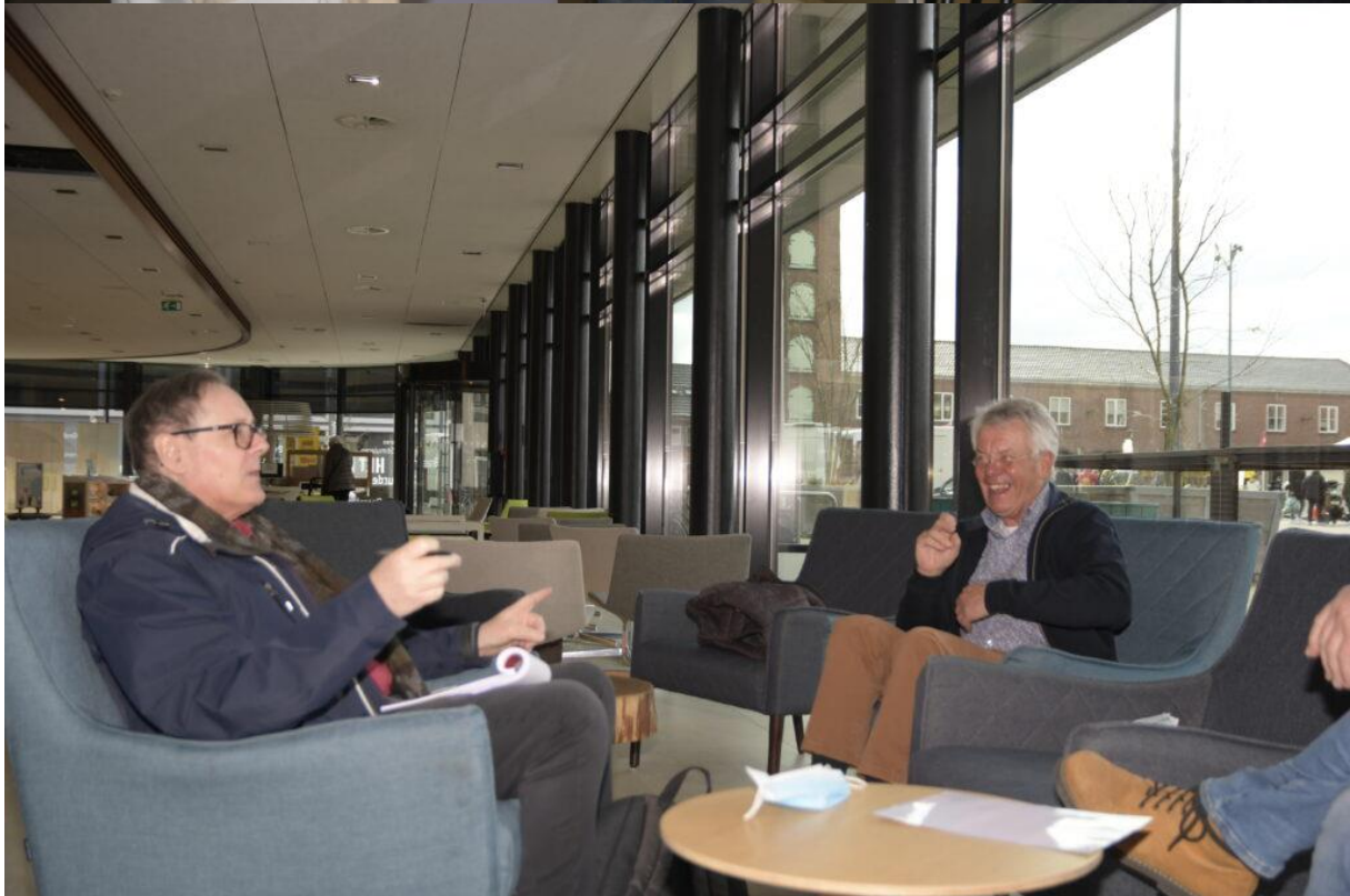
Ook filmende en schrijvende pers waren aanwezig om interviews af te nemen.