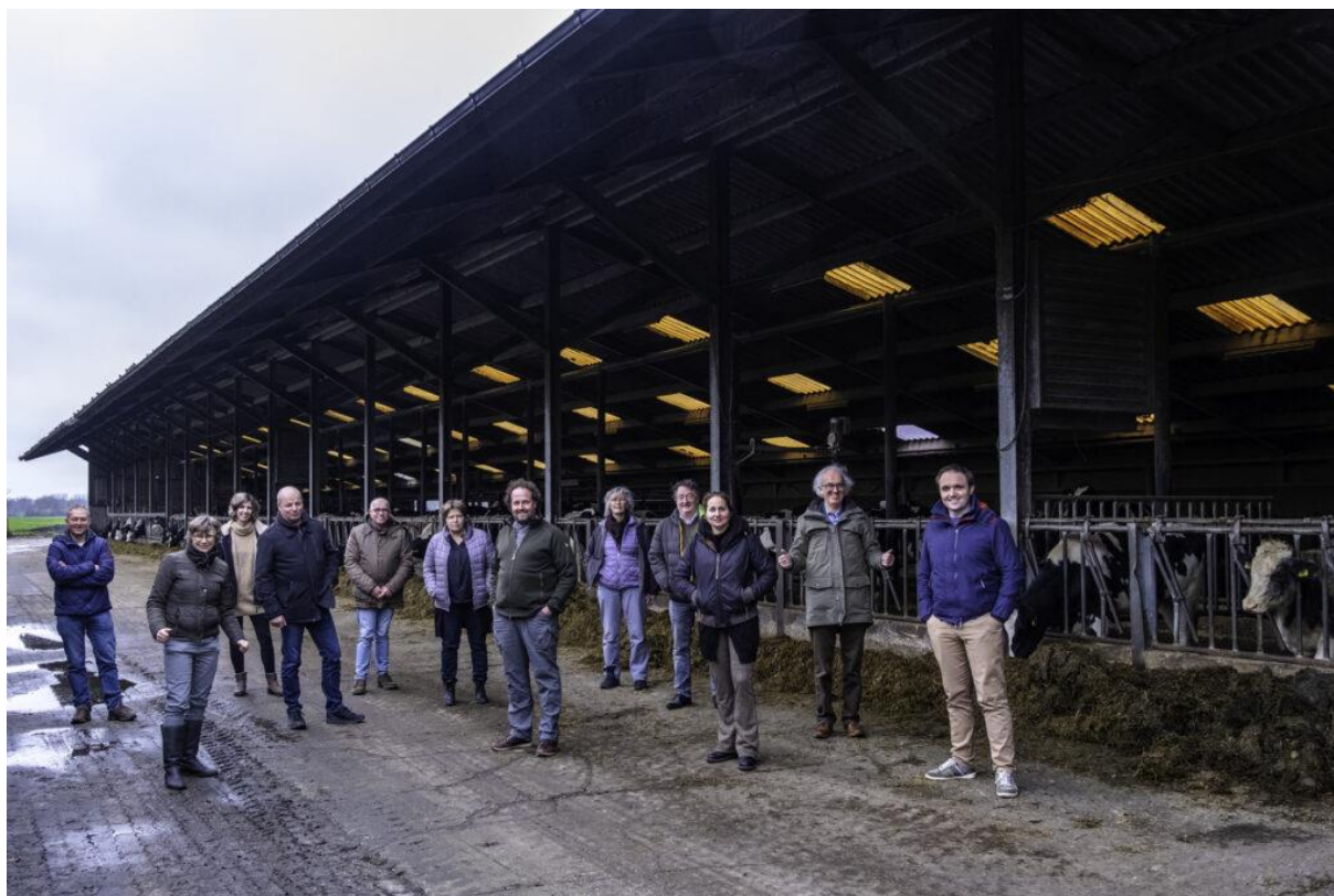
Deelnemers Zonnemaatje Duinboeren

Samenwerking met energie coöperatie leidt tot win-win situatie voor boer en burger.