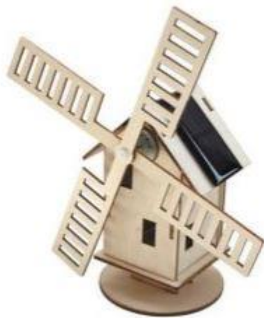
Bouwpakket Solar windmolen

Om in stijl te blijven kun je ook kennismaken met ECLoZ | om bij Loons Lokaal, nieuwe conceptstore aan de Kerkstraat in Loon op Zand, met aanbod van lokale ondernemers. Koop je het bouwpakket van de Solar Windmolen en stap je over op groene energie van ECLoZ | om , krijg je de kosten van aankoop van het bouwpakket terug.